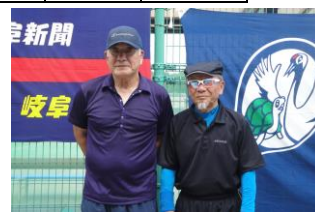
準優勝 杉戸・松森組