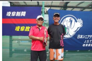
優勝 草薙・水野組