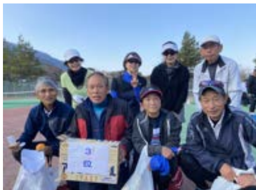
三位 上南木チーム